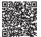
Allgemeiner-Teil_ASOneu (Anlage 1 und 2)