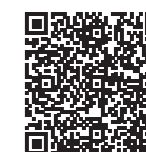
Allgemeiner-Teil_ASOneu (Anlage 1 und 2)